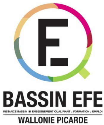
Photo locale de la demande d'emploi Wapi